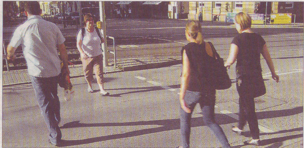
Kurze Strecken können in der Stadt am besten zu Fuß zurückgelegt werden.

Im Rahmen des Kongresses unterzeichnete OB Schuster die „Internationale Charta für das Gehen“. Damit erkennt die Stadt Stuttgart „den hohen